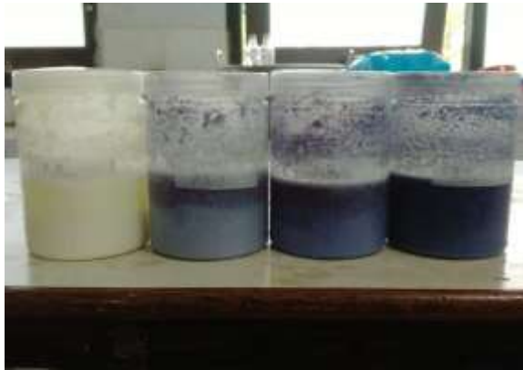
Gambar 1. Produk Kefir Susu Kambing dengan Penambahan Bubuk Bunga Telang

Hasil penelitian mengenai kefir susu kambing dengan penambahan bubuk bunga telang disajikan dalam bentuk data pada (Tabel 1). Pengaruh secara umum mengenai penambahan bubuk bunga telang terhadap variabel penelitian adalah tidak berpengaruh nyata terhadap total BAL, berpengaruh sangat nyata terhadap kadar asam laktat, dan berpengaruh sangat nyata pada nilai pH kefir susu kambing. Penjelasan lebih lanjut mengenai pengaruh yang terjadi terhadap kadar asam laktat kefir susu kambing yang ditambahkan bubuk bunga telang disajikan pada (Gambar 3) sedangkan mengenai hubungan pengaruh terhadap pH kefir susu kambing disajikan pada (Gambar 4).