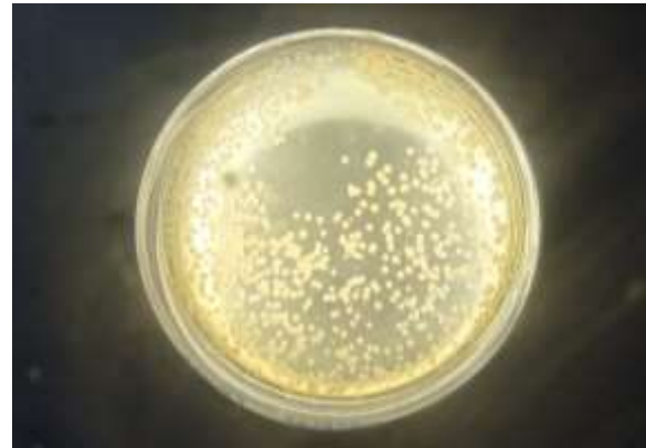
Gambar 2. Koloni BAL pada Kefir Susu Kambing dengan Penambahan Bubuk Bunga Telang