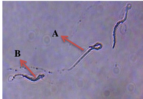
Gambar 1. Keterangan A= spermatozoa hidup (tidak menyerap warna), B= spermatozoa mati (menyerap warna)

pewarna eosin negrosin (Susilawati, 2011). Sel spermatozoa yang motil atau hidup tidak berwarna sedangkan sel spermatozoa yang tidak motil atau dianggap mati menghisap warna. Perbedaan antara spermatozoa yang hidup dan yang mati dapat dilihat pada Gambar 1.