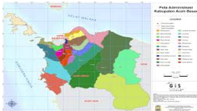
Gambar 1. Peta Administrasi kabupaten Aceh Besar

Pada Gambar 2 memperlihatkan potensi Kabupaten Aceh Besar bahwa di semua kecamatan yang ada ternak sapi dan kerbau merupakan komoditas unggulan. Potensi pasar dalam daerah dan antar kabupaten sangat terbuka dan berpeluang besar. Kabupaten Aceh Besar mendapatkan pemasukan dan hasil ternak dari daerah lain sebesar 5.100 ekor per tahun yang berasal dari Kota Banda Aceh, Kabupaten Pidie, Bireun, Provinsi Sumatera Utara dan Lampung (Dinas Peternakan Aceh Besar, 2017).