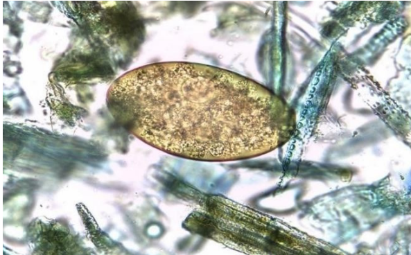
Gambar 1. Fasciola sp.

sp. memiliki telur berbentuk oval berwarna biru keabu-abuan karena memiliki dinding telur yang tipis sehingga mudah menyerap zat warna empedu, yodium atau methylene blue , kerabang telur transparan, dan sel embrional lebih terlihat jelas daripada telur Fasciola sp.