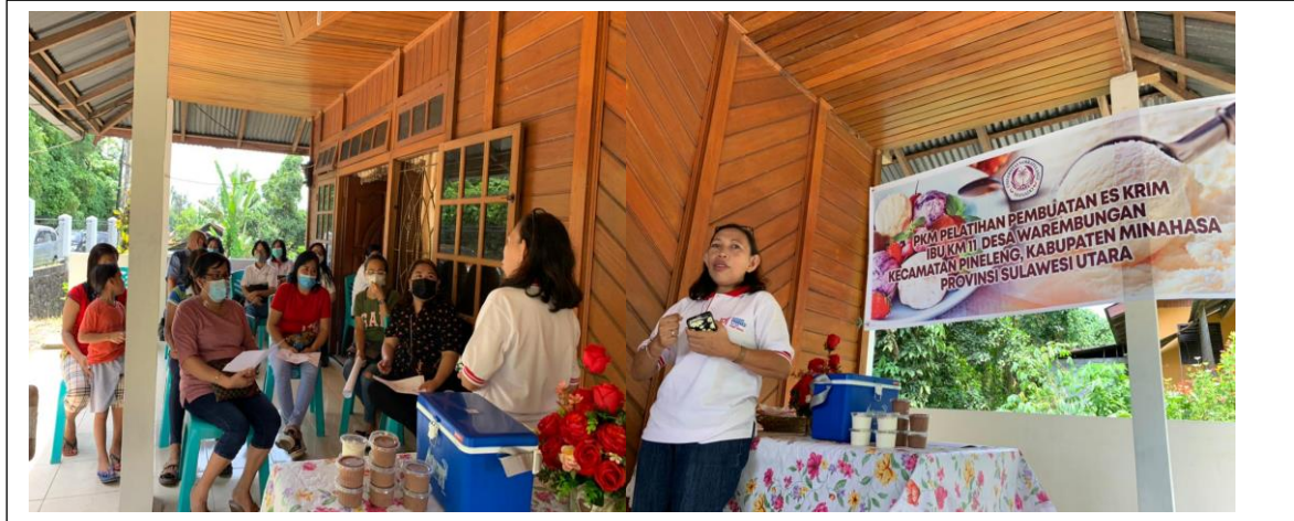
Gambar 1. Pelatihan Pembuatan es krim.

Pelatihan pembuatan es krim pada kelompok tani dapat dilihat pada Gambar 1. Peserta adalah ibu-ibu dari Desa Warembungan Kabupaten Minahasa. Provinsi Sulawesi Utara. Narasumber tim pelatihan dari Tim Fakultas Peternakan Universitas Sam Ratulangi Manado.