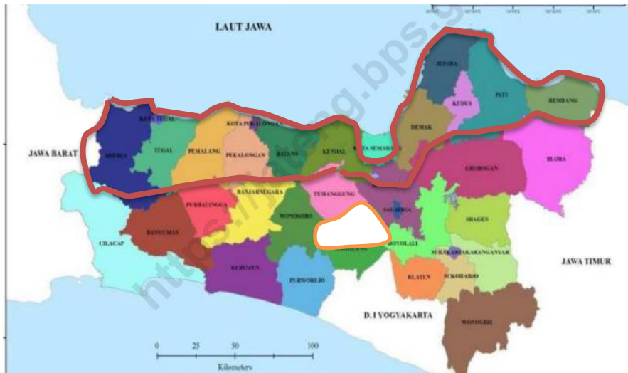
Gambar 2. Peta Lokasi Pengembangan Ternak Kerbau di Provinsi Jawa Tengah

Pada Gambar 2 terlihat bahwa pengembangan ternak kerbau terkonsentrasi di wilayah Pantura membujur dari barat sampai ke timur dan 1 wilayah di bagian tengah provinsi. Kondisi tersebut menunjukkan bahwa daging kerbau sangat disukai masyarakat di Wilayah Pantura, sehingga di wilayah tersebut harus ditingkatkan lagi pengembangan ternak kerbau dengan menggunakan strategi perencanaan yang bagus.